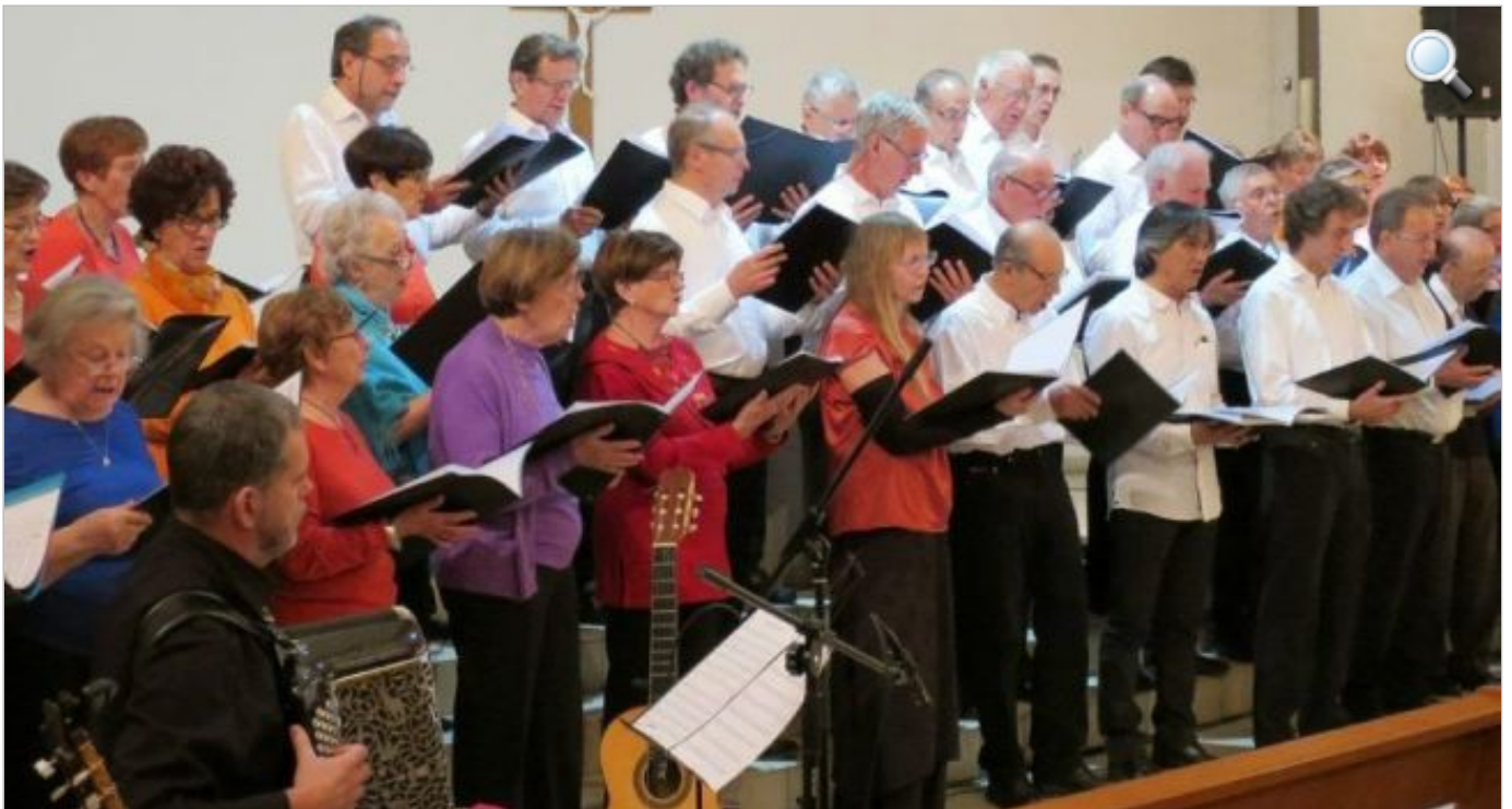
La chorale Chant d'Autan de Ramonville

Dans le cadre de la Journée mondiale du refus de la misère, célébrée tous les ans depuis 1987, la chorale Chant d'Autan de Ramonville apportera sa pierre à l'édifice en proposant un concert exceptionnel ce samedi 17 octobre en l'église Saint-Aubin de Toulouse à 15 heures.